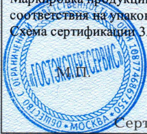
Схема сертификации 3.

Маркировка продукции знаком соответствия производится по ГОСТ Р 50460-92. Место нанесения знака соответствия на упаковке и в сопроводительной документации.